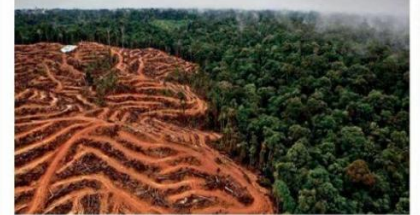
Raubbau am Amazonas: Zerstörung der Schöpfung stoppen!